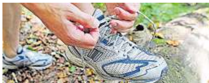
Einfach mal die Laufschuhe schnüren und loslegen.

Infos unter www.spielanlage-saar.de oder bei der Kreisstadt St. Wendel, Tel. (06851)809-1930.